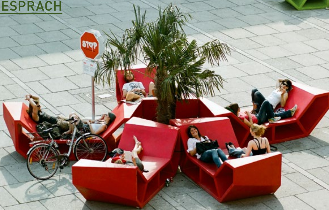
Im Museumsquartier in Wien sind die «Enzos» ein Hit: Bald sollen sie den ETH-Campus beleben.