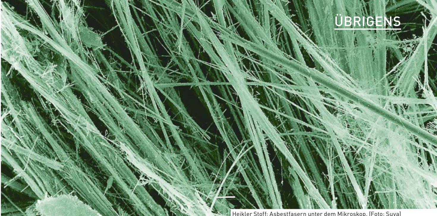
Heikler Stoff: Asbestfasern unter dem Mikroskop.