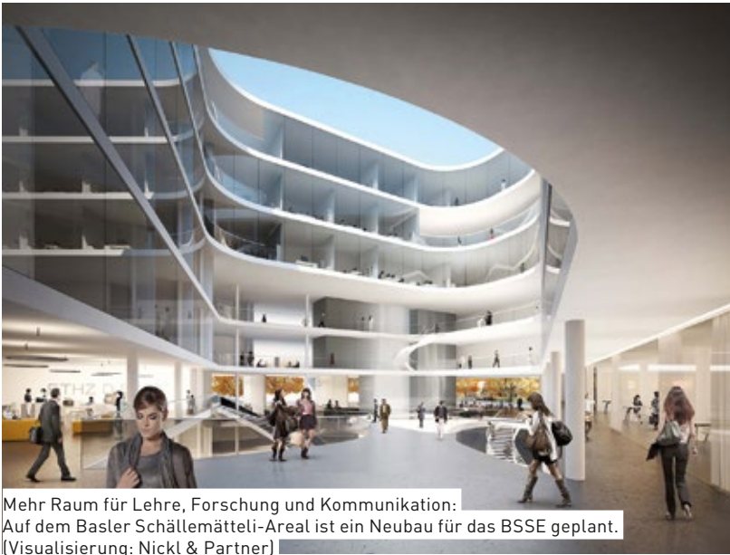
Mehr Raum für Lehre, Forschung und Kommunikation: Auf dem Basler Schällemätteli-Areal ist ein Neubau für das BSSE geplant. (Visualisierung: Nickl & Partner)

► mit den experimentell forschenden Biologen am D-BSSE, die an Stammzellen untersuchen, wie sich Zellen entwickeln und verändern. «In Basel finde ich alle Infrastrukturen vor, die ich für meine Forschung brauche», sagt Stadler auf dem