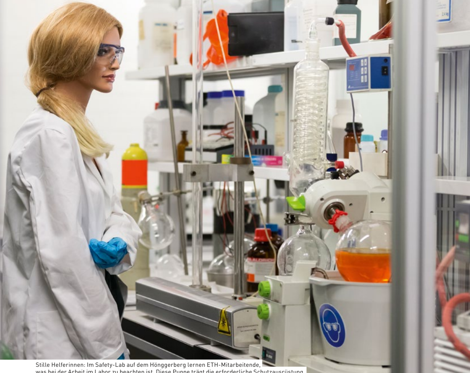
Stille Helferinnen: Im Safety-Lab auf dem Hönggerberg lernen ETH-Mitarbeitende, was bei der Arbeit im Labor zu beachten ist. Diese Puppe trägt die erforderliche Schutzausrüstung.